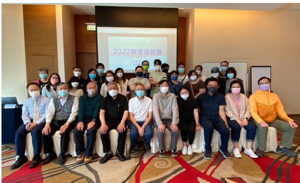
聯堂同工與堂委員退修營合照。願主賜福香港靈糧堂及各分堂蒙恩成長，得力發展！

大部分都表示在個人靈修、禱伴分享、敬拜讚美、培靈信息、專題研討、個人默想、守望祈禱等方面得到幫助。我們以多元化的方式向各堂分享我們發展慕道者崇拜的經驗，堂校協作的策略，以及在質素及人數方面蒙恩增長的見證。願榮耀歸神，也祝願各堂同工學以致用，蒙恩成長！